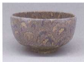
松井康成「晴白練上茶碗」

〈参加費〉2,500円〈定員〉各15名 ※参加を希望される方は、3日前までにお申し込みください。