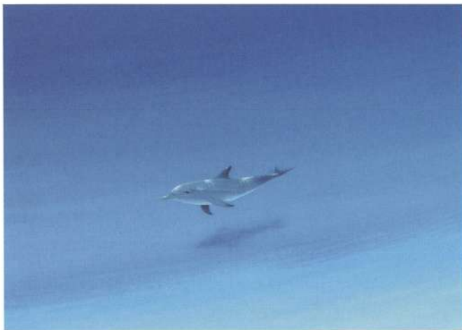
絵本『イルカの星』表紙より

絵本作家・葉祥明は、1973年にデビューしてから現在までおよそ230冊の絵本を出版しました。装丁や挿絵に携わった出版物を合わせると500冊余りになります。