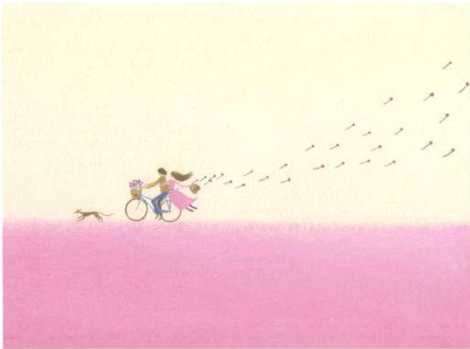
「そよ風のデュエット」、詩画集『Life is……』より